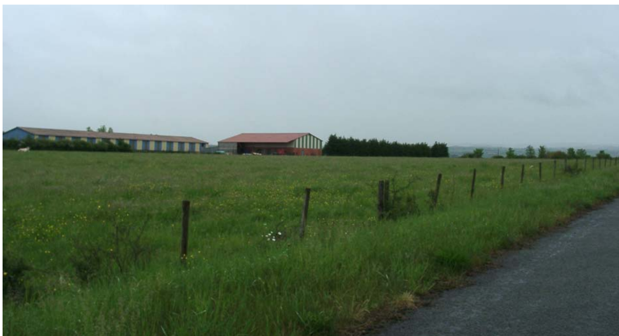
Bâtiments d'activité existant sur le site